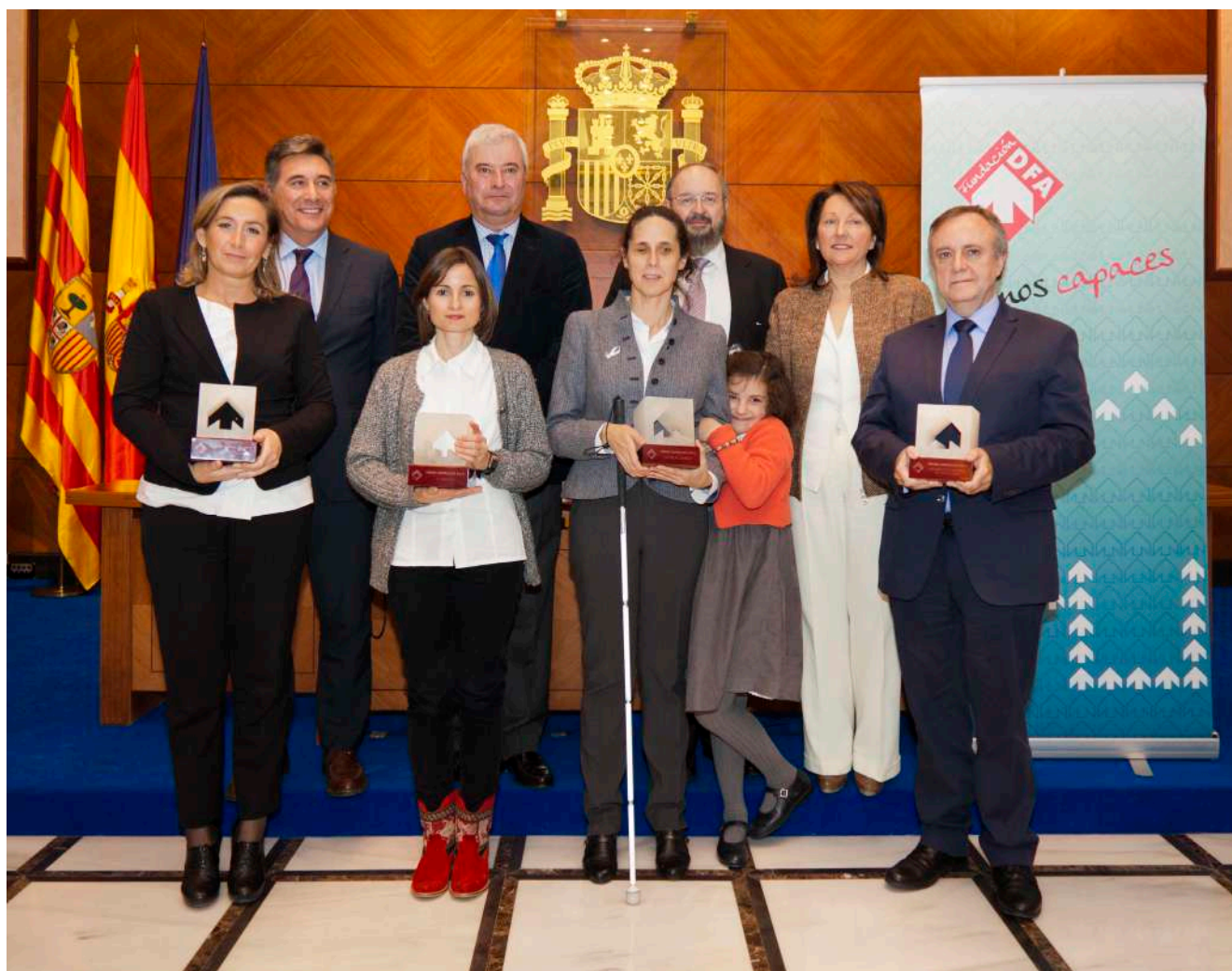
Los premiados con los representantes institucionales y el Presidente de Fundación DFA en la foto de familia.

Fundación DFA premia, año tras año, la labor de entidades y personas que trabajan por la igualdad, la participación social y los derechos de las personas con discapacidad. En 2013, los Premios Zangalleta han alcanzado su vigésima edición