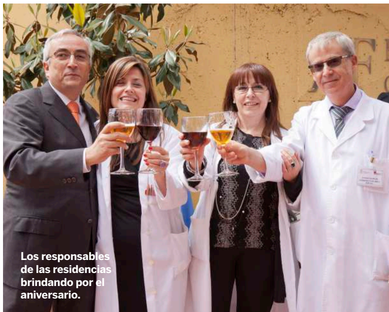
Los responsables de las residencias brindando por el aniversario.