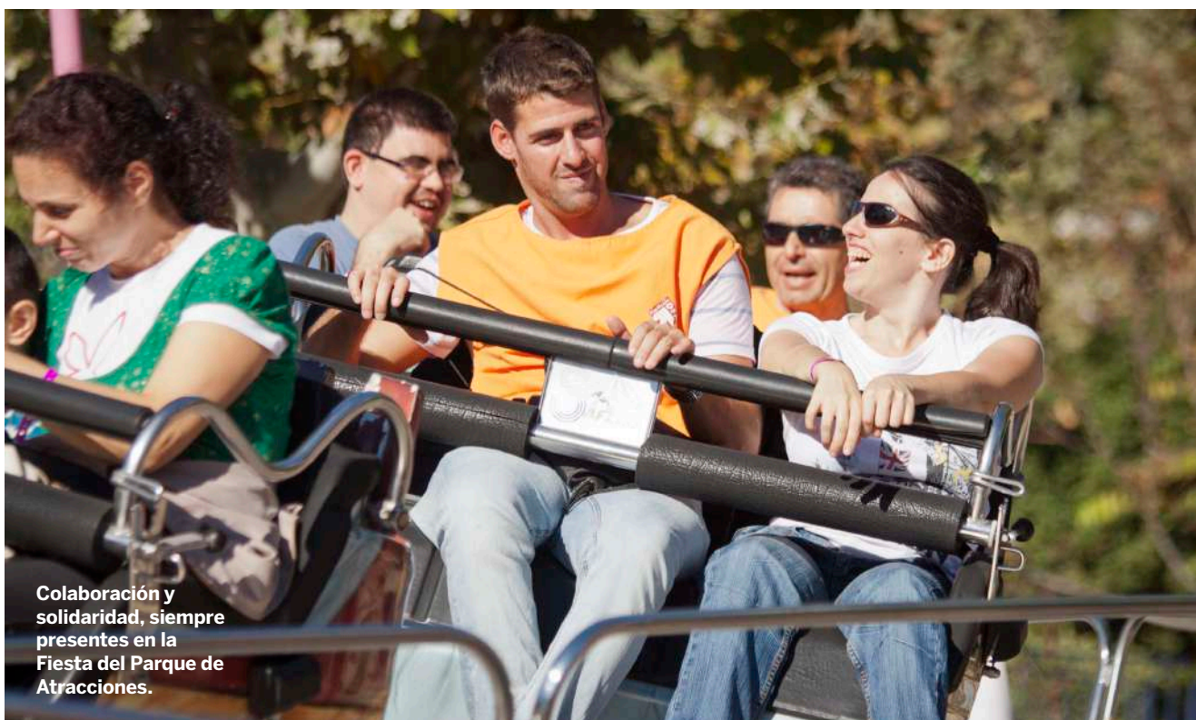
Colaboración y solidaridad, siempre presentes en la Fiesta del Parque de Atracciones.

El Parque de Atracciones de Zaragoza se convirtió en un punto de encuentro y convivencia. Un día festivo con más de 100 voluntarios y los artistas y grupos de animación que colaboran año tras año para que la jornada sea un éxito