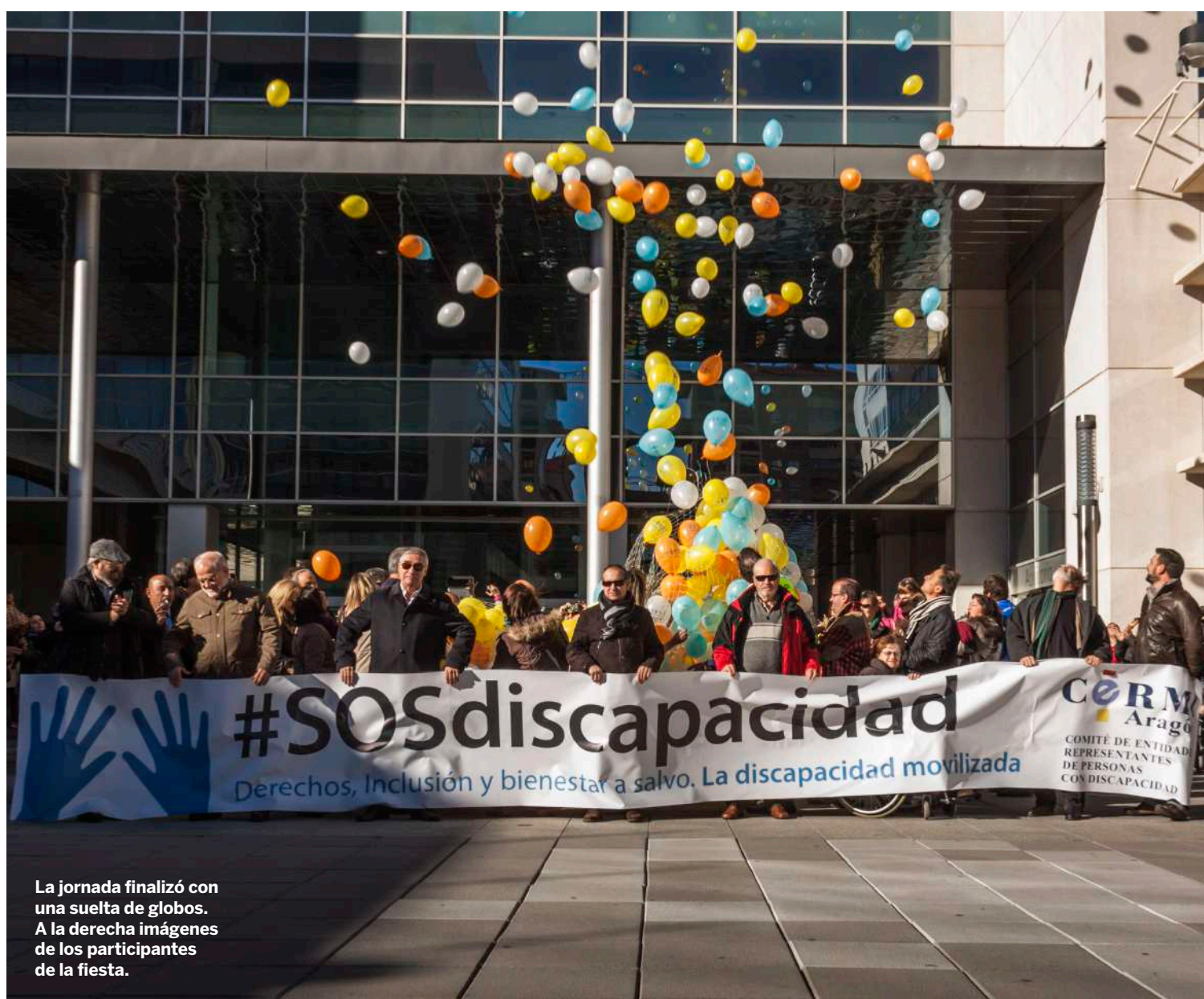
La jornada finalizó con una suelta de globos. A la derecha imágenes de los participantes de la fiesta.