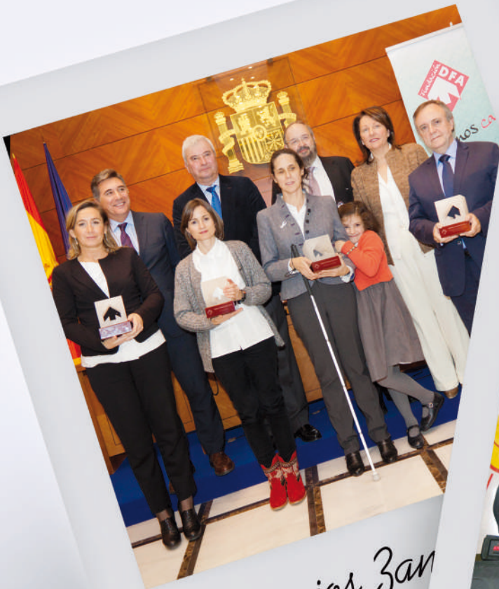
Premios Zan 27 / 11 /