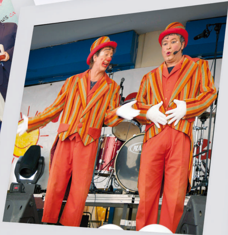
Fiesta por la Integración 27 / 10 / 2013

3 Dic 2013 Día Internacional de las personas con discapacidad